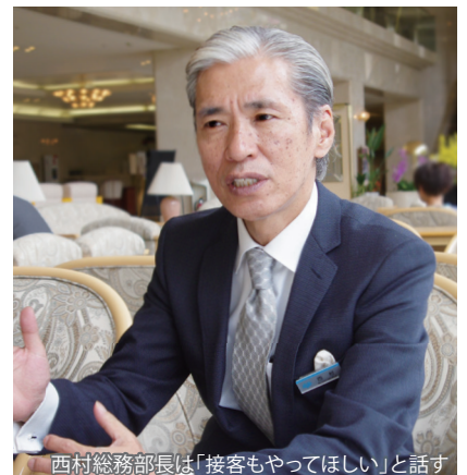
西村総務部長は「接客もやってほしい」と話す