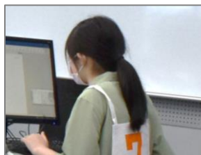
ぎふアビリンピック2022 「ワード・プロセッサ」種目の様子